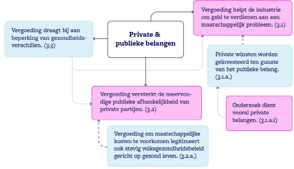
Figuur 1: Beeldsamenvatting argumentenwijzer