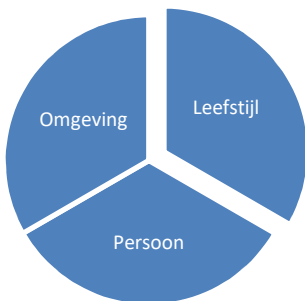
Figuur 2 Determinanten van gezondheid

nemers bij aan hun inzetbaarheid. Een slechte gezondheid of ziekte kan er toe leiden dat werknemers (tijdelijk) minder productief zijn op hun werk en dat zij niet meer inzetbaar zijn of niet lang inzetbaar blijven op de arbeidsmarkt.