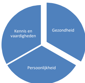
Figuur 1 Relevante factoren werknemers voor duurzame inzetbaarheid

Volgens een rapport van ZonMw (Van der Klink ea. 2010) betekent duurzaam inzetbaar “dat medewerkers doorlopend in hun arbeidsleven over daadwerkelijk realiseerbare mogelijkheden alsmede over de voorwaarden beschikken om in huidig en toekomstig werk met behoud van gezondheid en welzijn te (blijven) functioneren.” Dat vraagt een werkcontext die werknemers hiertoe in staat stelt en de attitude en motivatie van werknemers om deze mogelijkheden daadwerkelijk te benutten (Van der Klink ea. 2010).